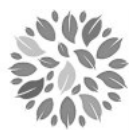
Palliativnetzwerk Landkreis Waldshut

Wir begleiten Menschen mit schweren fortgeschrittenen Erkrankungen bis zum Lebensende. Unser Ziel ist, Sie und Ihre Angehörige individuell zu unterstützen.